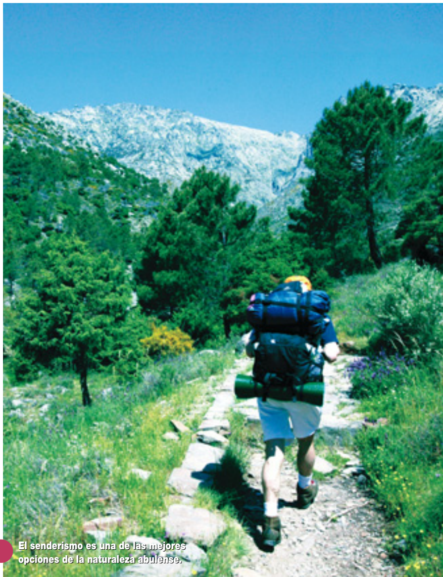
El senderismo es una de las mejores opciones de la naturaleza abulense.

Sexta etapa. Desde Arévalo termina el camino abulense. Tras recorrer casi 33 kilómetros se alcanza Medina del Campo, ya en tierras vallisoletanas. El impresionante Castillo de la Mota, la Plaza Mayor de la Hispanidad, la colegiata de San Antolín y el ayuntamiento son algunos de los edificios que conviene visitar.