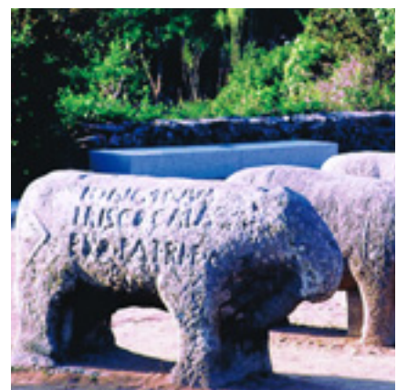
Los Toros de Guisando.

En las tierras abulenses se mantienen aún hoy interesantes pedazos del pasado: los castros y los verracos son vetustos legados históricos que salpican las tierras de Ávila añadiendo un aliciente más para recorrer las hermosas sendas